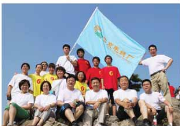
集团领导与员工合影

企业自加入北京铜牛集团后连续参加集团公司举办的登香山比赛，通过集体登山的方式，传承铜牛文化、展示企业风貌。在享受登山喜悦的同时，企业团体和个人的比赛成绩也在逐年提高。