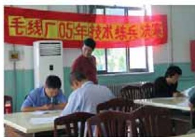
员工技能练兵比赛