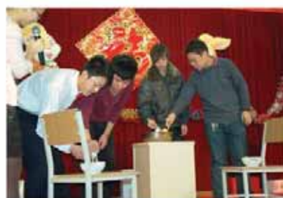
员工在团拜会上参加游戏