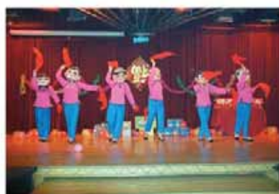
员工在团拜会上表演舞蹈