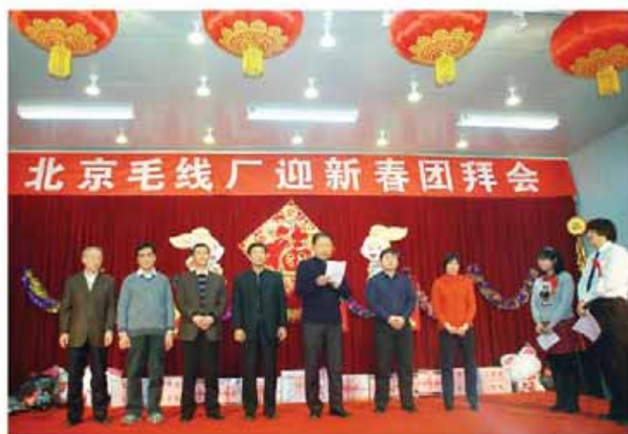
厂领导班子成员给员工拜年

为慰问企业辛勤工作一年的员工，企业于2006年开始举办迎新春团拜会。在充满节日氛围的会场上，厂长发表新春祝辞；领导班子成员给员工拜年；员工表演自编的节目，如独唱、合唱、小品、舞蹈、三句半等。团拜会活动进一步融洽了企业员工之间的关系，增强了企业的凝聚力。