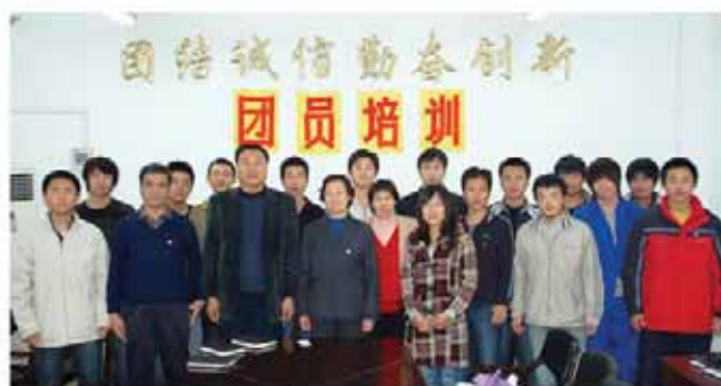
厂领导与团员合影

演讲会等，鼓励员工争当技术状元与岗位能手，激发员工的工作热情，陶冶员工的情操，营造企业的良好文化氛围。