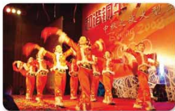
中秋主题晚会剪影

一年一度的中秋主题晚会已经成为铜牛股份每一位员工期待的节日，股份公司坚持以人为本，创造人尽其才的工作和生活环境，塑造了“厚德载福”的文化氛围。欢快的舞蹈，悠扬的歌声，银铃般的笑声永远是铜牛大家庭最和谐乐章。