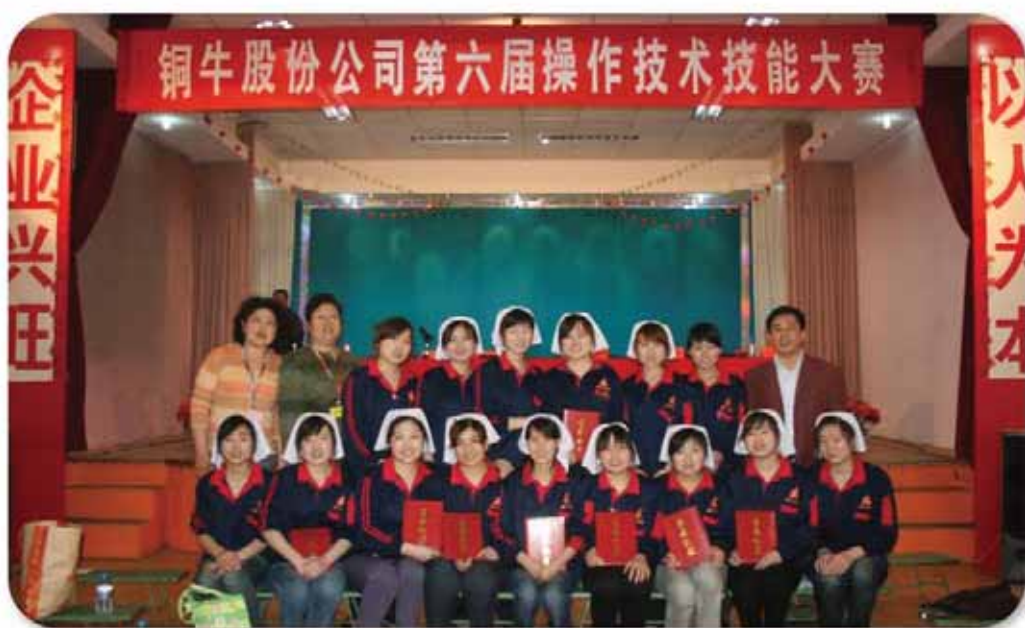
员工技术技能大赛剪影

操作技术技能大赛是铜牛股份公司结合生产经营发展的需要，号召员工不断提高技术操作水平，推动企业科技进步，进一步增强企业综合竞争力为目标，把培养造就一支技术水平高、操作技能精、业务能力强的员工队伍。